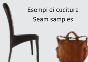
Esempi di cucitura Seam samples