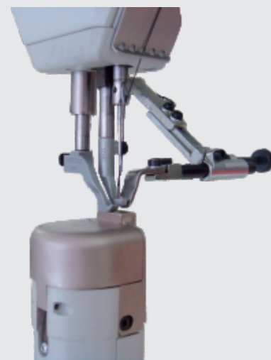
Particolare degli organi di cucitura Sewing parts detail